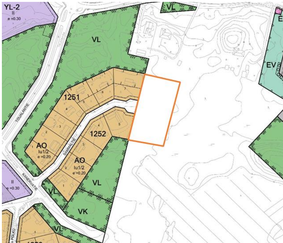
Kuva 3. Suunnittelualue on asemakaavoittamaton aluetta. Se kytkeytyy vuonna 2001 laadittuun Junkkarin asemakaavaan.